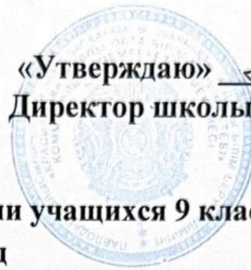
График сдачи экзаменов, итоговой аттестации учащихся 9 класса на 2025-2026 учебный год

КГУ «Крсиловской СОШ»отдела образования Щербактинского района, управления образования Павлодарской области.